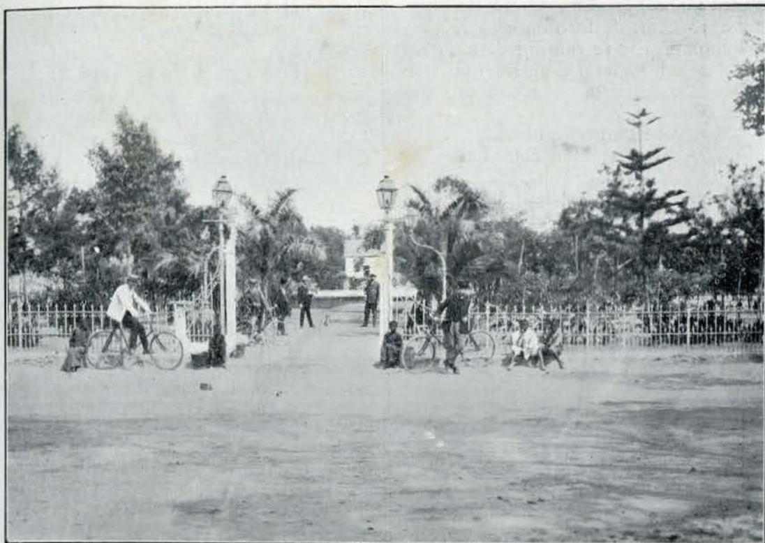
Jardim Publico, Benguella — por Jiberio J. d'Oliveira