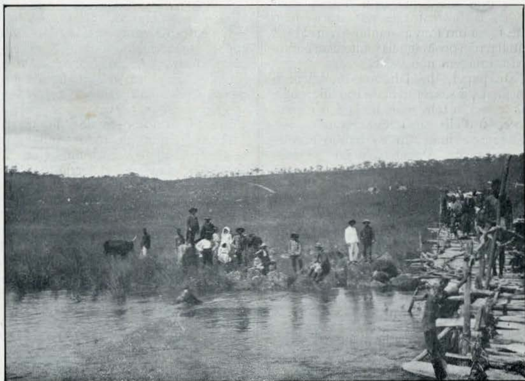
Uma passagem e margem do rio Cutato, Bihé — por Francisco Cypriano Pio